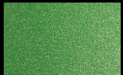
0961 Apple Green