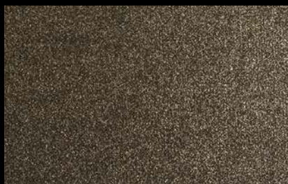
1910 Black with gold glitters