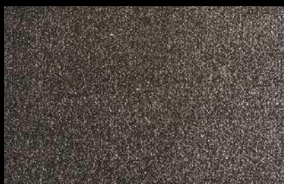
0910 Black with silver glitters